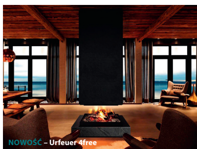
NOWOŚĆ – Urfeuer 4free