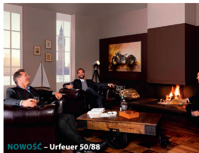
NOWOŚĆ – Urfeuer 50/88