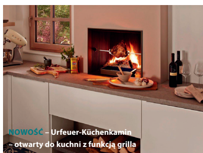
NOWOŚĆ – Urfeuer-Küchenkamin – otwarty do kuchni z funkcją grilla