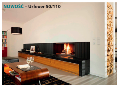
NOWOŚĆ – Urfeuer 50/110