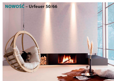
NOWOŚĆ – Urfeuer 50/66